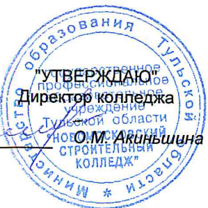
ГРАФИК УЧЕБНОГО ПРОЦЕССА